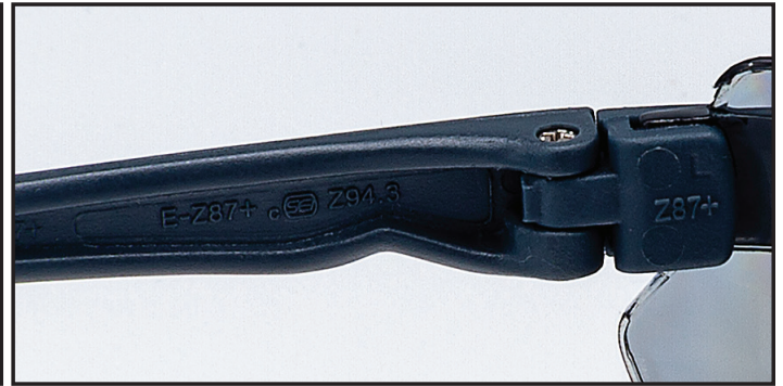
Certificado por laboratorio externo